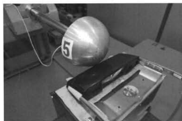
図4 試験状況 (斜め前)