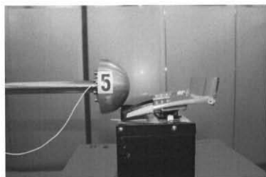
図3 試験状況 (横)