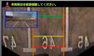
ハイアングルモード P in P 表示