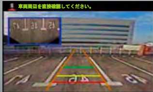
ノーマルアングルモード P in P 表示