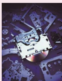
メカトロ事業 開発・製造