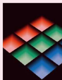
有機EL(OLED)事業 企画・開発・製造・販売