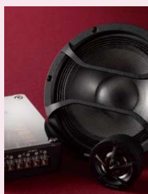
スピーカー事業 企画・開発・製造・販売